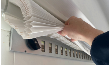
Ventilatie-roosters bij de ramen schoonmaken