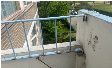
Balkonhekken controleren en vastzetten waar nodig