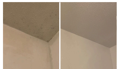
Schimmel behandelen in de badkamer en het toilet