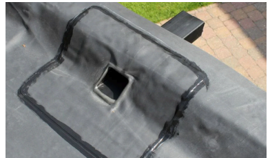
Werken op het dak zodat het water beter wegloopt