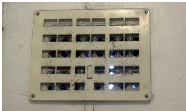
Achter de ventilatie-roosters schoonmaken