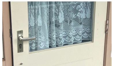
Scharnieren van de ramen en balkondeuren checken