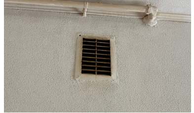
Ventilatie-roosters in de muren schoonmaken